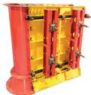
AJINEH / Formworks and Accessories / 2